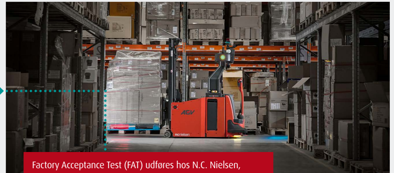
Factory Acceptance Test (FAT) udføres hos N.C. Nielsen, hvor du har mulighed for at deltage.