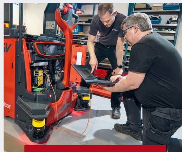
Design af AGV, softwareudvikling og simulering af projektet og tilbudsgivning.