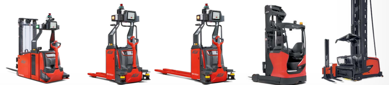
NCN AGV L06 FF Modvægts-stabler

Få adgang til branchens stærkeste serviceorganisation med et landsdækkende netværk af 120 servicemontører, der står klar til at rykke ud – og nyd godt af vores specialister i AGV-teknologien.