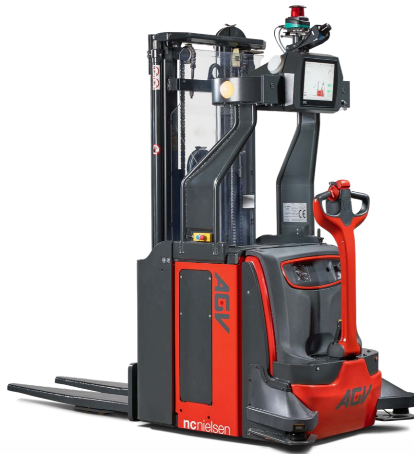
NCN AGV L06 LA Stabler