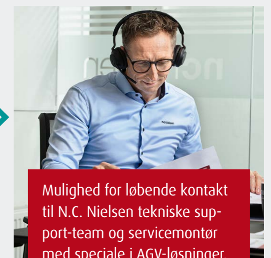
Mulighed for løbende kontakt til N.C. Nielsen tekniske support-team og servicemontør med speciale i AGV-løsninger.