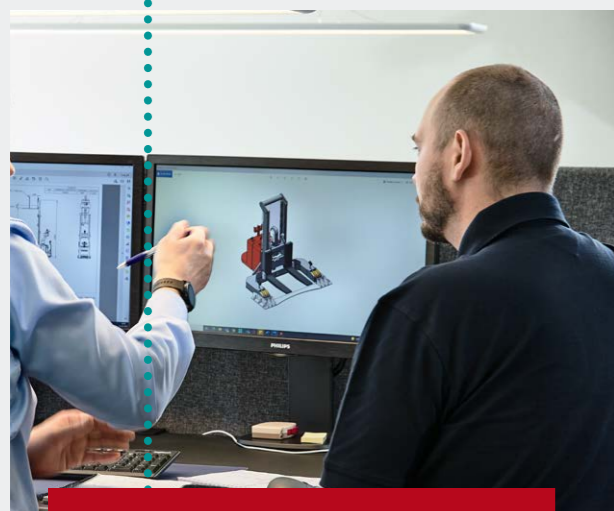
AGV-teamet fra N.C. Nielsen analyserer mulighederne for dit AGV-projekt og kommer med anbefalinger til valg af model og forslag til projektets gennemførelse.