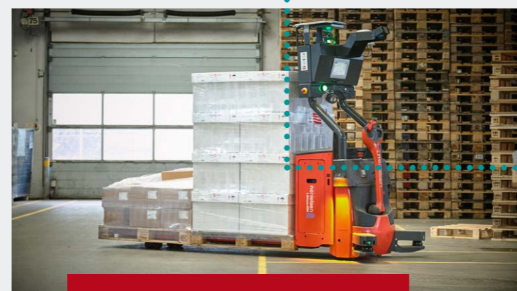
Levering, igangsættelse, Site Acceptance Test (SAT) og træning af personale i din virksomhed.