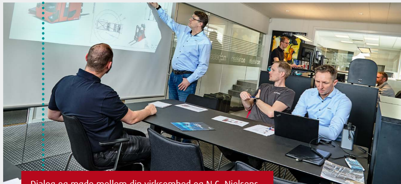
Dialog og møde mellem din virksomhed og N.C. Nielsens AGV account manager omkring behov og ønsker.

Det sikrer en optimal fremdrift i AGV projektet og en AGV-løsning med høj performance fra start.